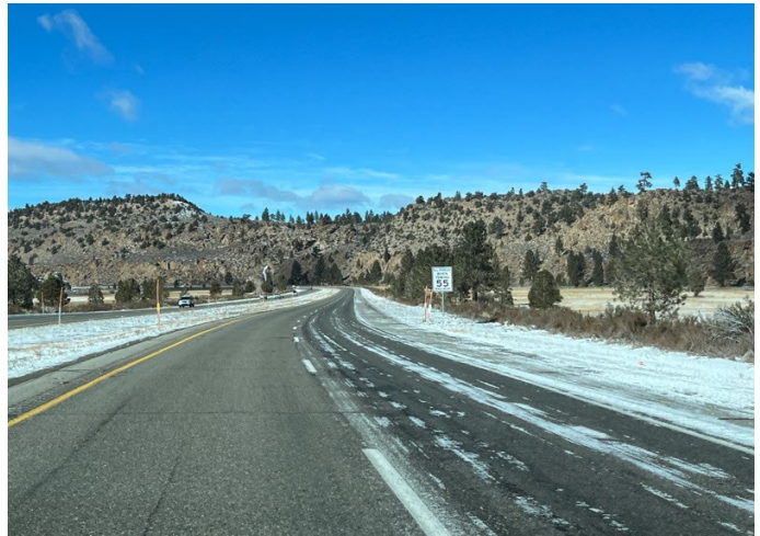
Al Lago Convict

En Lone Pine vimos un aspersor junto a la carretera que se encendía cada pocos minutos. En el frío creaba estalactitas de carámbanos en el árbol y estalagmitas en la hierba. Desde que nos detuvimos allí, pudimos leer todo sobre el viejo roble vivo que comenzó como un recorte de un árbol en el bosque de Sherwood con Robin Hood.