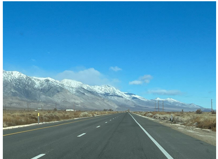
Al norte de Lone Pine

Solo pudimos quedarnos un par de noches, así que nos fuimos a ver qué podíamos ver. Teníamos reservas para quedarnos en Lone Pine, California. Cogimos un SUV de tracción delantera con cadenas portacables, por si acaso. Las temperaturas pronosticadas alrededor de Lone Pine eran para un clima frío despejado, 20 grados por la noche, 30 y 40 grados durante el día. Lone Pine está a unas 300 millas de San Diego, por lo que tomó alrededor de 6 horas en total con un poco de tráfico al principio. No podíamos salir temprano, así que llegamos un poco antes del anochecer.