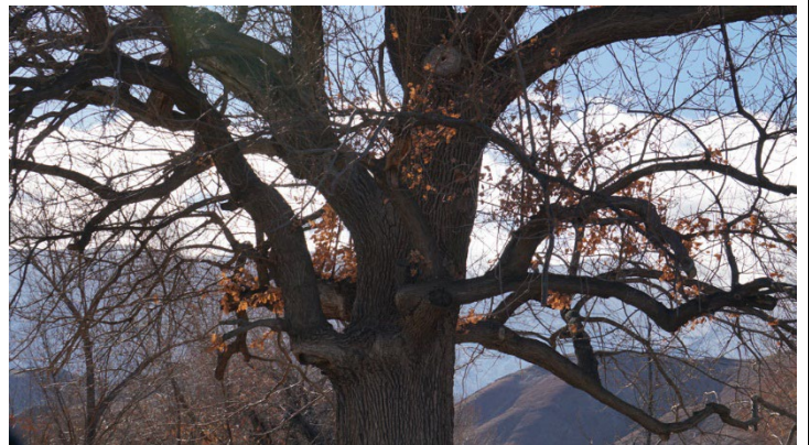
Pino solitario - Roble pendunculado inglés del bosque de Sherwood, Inglaterra-Tierra de Robin Hood