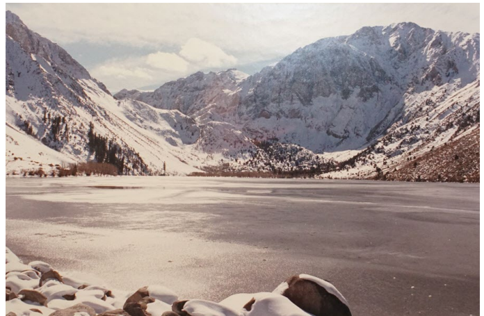
Lago Convict Cerca de Mammoth Lakes, California

Quería hacer un viaje corto por carretera después de sobrevivir a las vacaciones de este año. En algún momento de 2023, me encontré con esta ampliación enmarcada que fotografié en Convict Lake en las Sierras, cerca de Mammoth Lakes, California, en la CA395. Esta foto fue tomada cuando regresaba de un viaje de esquí en Mammoth a principios de la década de 1980. Convict Lake es uno de los muchos lugares únicos a lo largo de la 395. Pensé que sería divertido tomarme unos días y correr hasta la 395 hasta Bishop y tal vez Convict Lake y algún otro lugar. Quería encontrar la sección mágica y muy sinuosa de la carretera que conducía al Valle de la Muerte que había recorrido al anochecer durante el evento RedHot Riders Baby Butt 1000-mile Saddle Sore en 2002. Estaba bastante seguro de que era CA190 de Lone Pine, California, también en CA395.