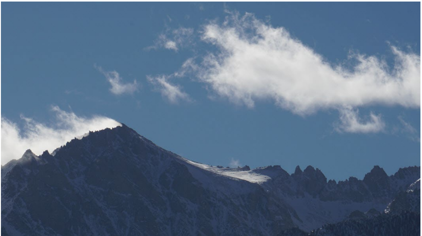
Picos cerca de Lone Pine