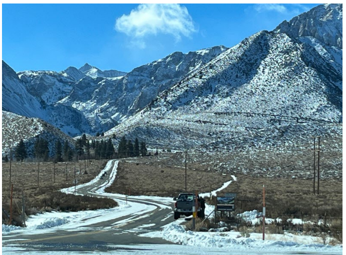
Al Lago Convict