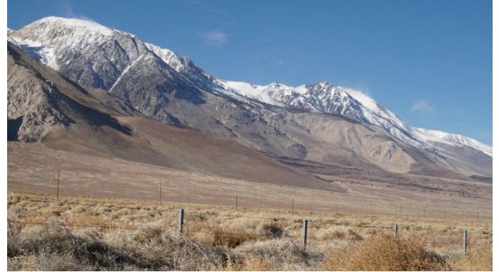
Picos cerca de Lone Pine

Era hora de ver lo que podíamos ver en el camino hacia el Valle de la Muerte a través de la CA190. Desde Lone Pine puede ir hacia el sureste por la CA136 para encontrarse con la CA190 y continuar hasta Panamint Springs y más allá.