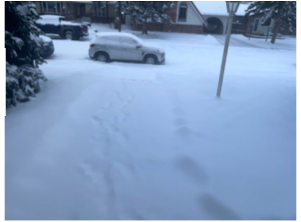
Imagen de Feliz Primavera (Columbia Británica, Canadá)

¡Espero que estéis disfrutando de este hermoso clima primaveral! Ok, tal vez no muchos de ustedes tengan temperaturas frías, nieve en el suelo o estén lidiando con fuertes lluvias. Tal vez estos primeros días de la primavera serían más divertidos si los pasaras en el garaje preparando tu(s) motocicleta(s) para los paseos de este año.