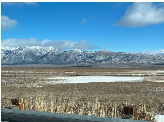
Al sur hacia el lago Crowley